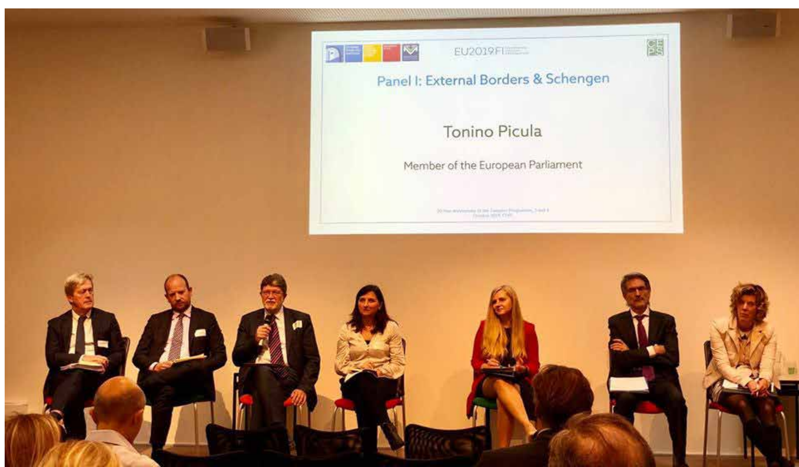
Govornik na konferenciji o Schengenu i vanjskim granicama u organizaciji CEPS-a i finskog predsjedanja EU-om.