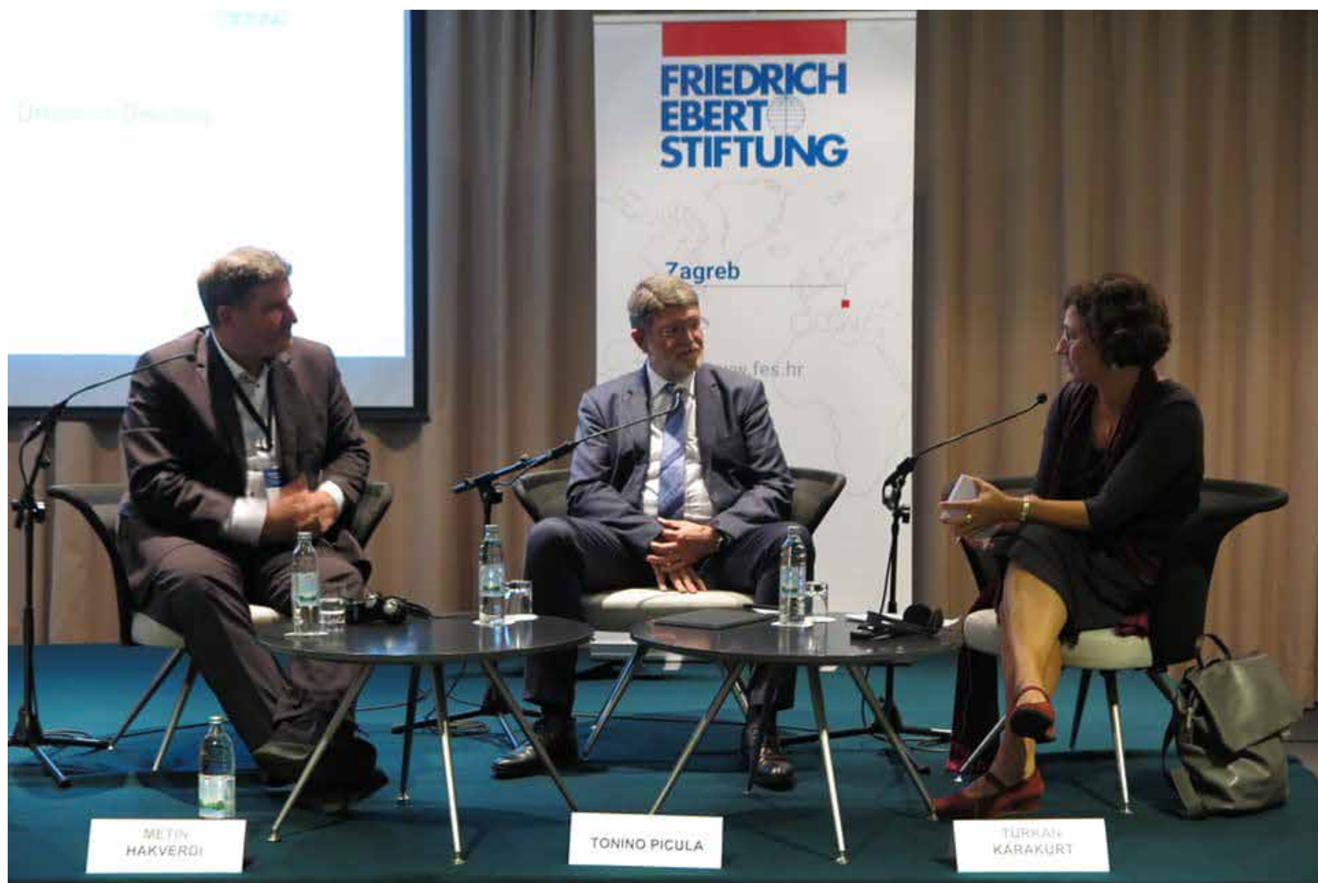
Picula kao uvodničar na jubilarnoj 20. međunarodnoj parlamentarnoj konferenciji Zaklade Friedrich Ebert „A European Union in Disarray – perspectives and challenges for Southeast Europe“.