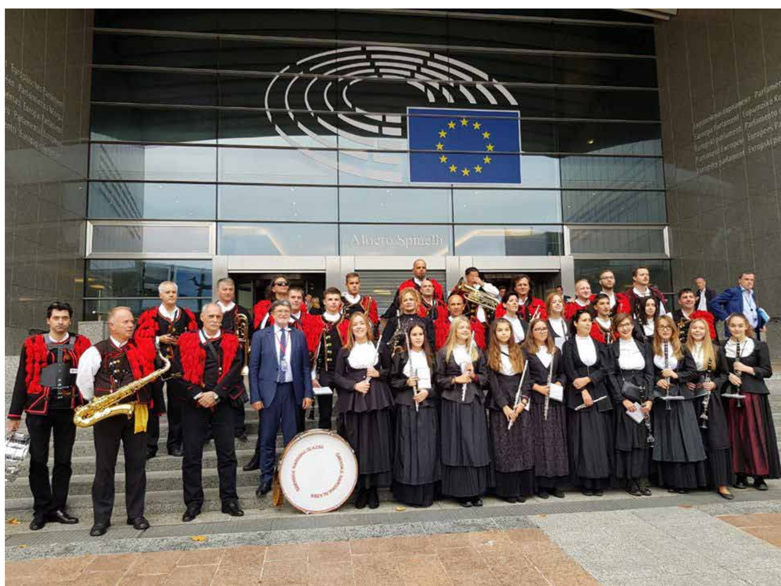
Ugostio Šibensku narodnu glazbu koja je svirala u Europskom parlamentu povodom 170. godišnjice njihovog rada