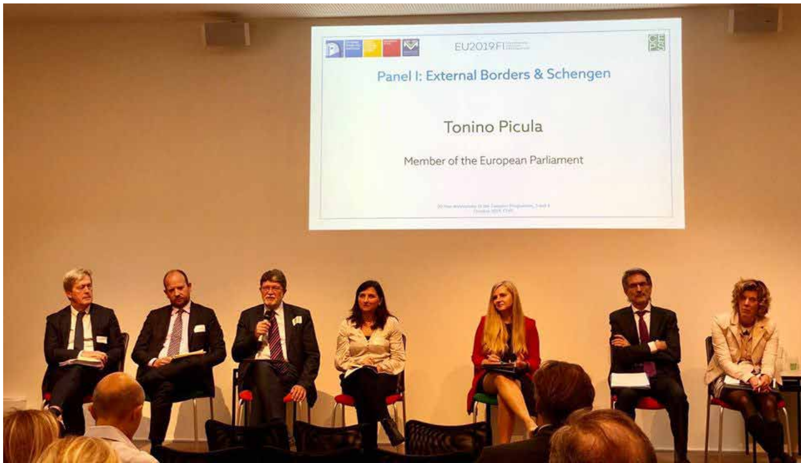
Govornik na konferenciji o Schengenu i vanjskim granicama u organizaciji CEPS-a i finskog predsjedanja EU-om.